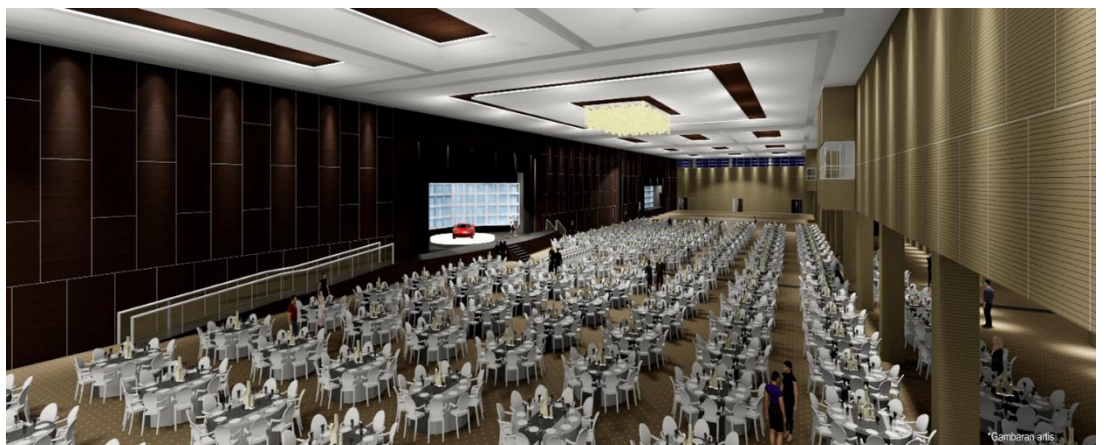
Pandangan Dewan Bankuet dengan kapasitas 3,000 orang