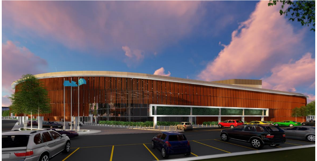
Pandangan dari Pintu Masuk dari kawasan Industri Permatang Pauh