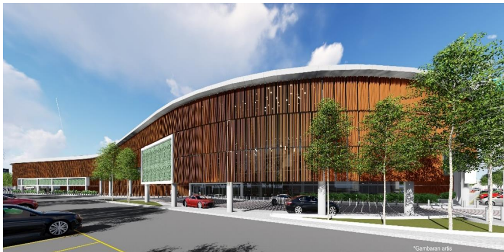
Pandangan dari Pintu Masuk Utama dari Jalan Ampang Jajar

Lakaran Artist Impression bagi kerja-kerja di tapak seperti berikut: