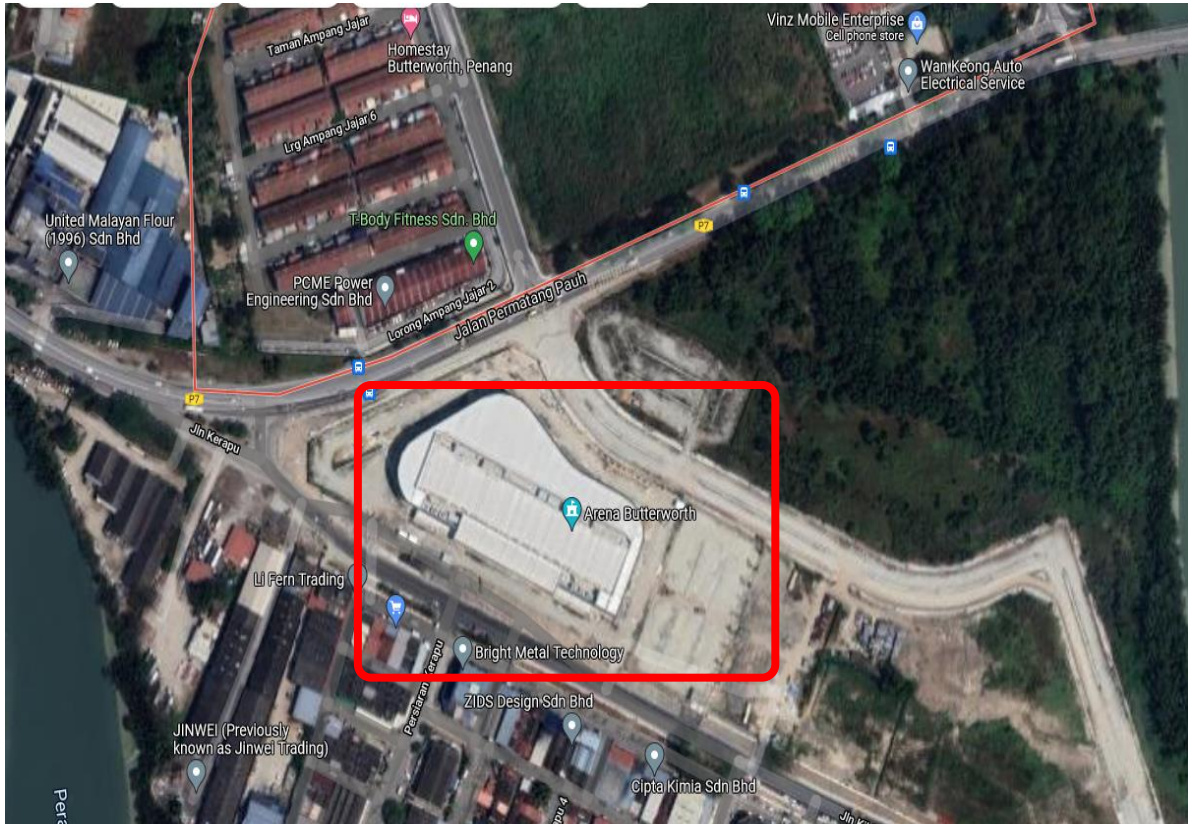
Pelan Lokasi: Butterworth Arena dan Tempat Letak Kereta Ampang Jajar, Jalan Permatang Pauh, 13400 Butterworth, Pulau Pinang