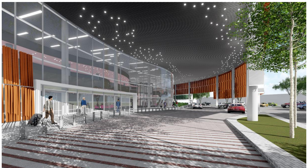
Pandangan Lobi Utama